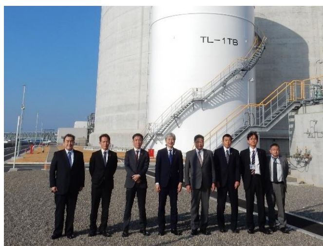
新居浜LNG及び株主各社の幹部