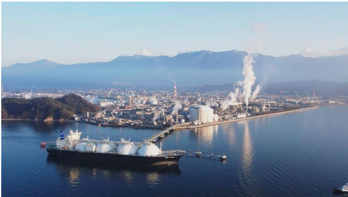
LNG タンカーと新居浜 LNG 基地、住友化学の愛媛工場

東京ガスエンジニアリングソリューションズ株式会社、四国電力株式会社、住友化学株式会社（以下「住友化学」）、住友共同電力株式会社（以下「住友共同電力」）、および四国ガス株式会社が共同出資する新居浜LNG株式会社（以下「新居浜LNG」）は住友化学愛媛工場構内（愛媛県新居浜市）において建設を進めていた、「新居浜LNG基地」の工事及び試運転を完了し、このたび同工場構内にガス供給を開始いたしました。また、近隣地区の産業向けガス供給についても本年3月の開始を予定しています。