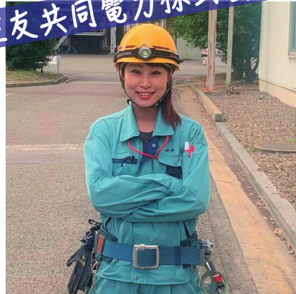
女性初の現場エンジニア!